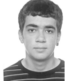
ΜΕΓΓΙΟΣ ΜΙΧΑΗΛ ΧΗΜΙΚΩΝ ΜΗΧΑΝΙΚΩΝ ΠΟΛΥΤΕΧΝΕΙΟ ΠΑΤΡΩΝ