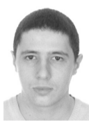
ΑΪΒΑΖΗΣ ΕΜΜΑΝΟΥΗΛ ΟΡΓΑΝΩΣΗΣ & ΔΙΟΙΚΗΣΗΣ ΕΠΙΧΕΙΡΗΣΕΩΝ ΠΑΝ/ΜΙΟ ΜΑΚΕΔΟΝΙΑΣ