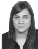
ΜΑΝΙΑ ΒΑΣΙΛΕΙΑ ΘΕΟΛΟΓΙΑΣ ΠΑΝ/ΜΙΟ ΑΘΗΝΩΝ