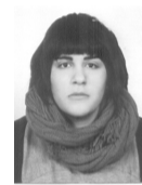
ΤΡΙΑΝΤΑΦΥΛΛΟΥ ΒΑΣΙΛΙΚΗ ΕΞΩΤ. ΑΡΧΙΤΕΚΤΟΝΙΚΗΣ, ΔΙΑΚΟΣΜΗΣΗΣ & ΣΧΕΔ. ΑΝΤΙΚ. ΤΕΙ ΣΕΡΡΩΝ