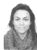
ΒΑΚΑΣΙΡΗ ΡΑΦΑΗΛΙΑ ΒΑΣΙΛΙΚΗ ΒΙΟΛΟΓΙΑΣ ΠΑΝ/ΜΙΟ ΘΕΣΣΑΛΟΝΙΚΗΣ