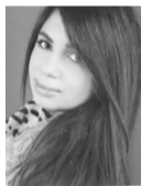
ΒΙΚΑΤΟΥ ΜΑΡΙΑ ΟΙΚΟΝΟΜΙΚΗΣ ΕΠΙΣΤΗΜΗΣ ΟΙΚΟΝΟΜΙΚΟ ΠΑΝ/ΜΙΟ ΑΘΗΝΑΣ