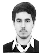
ΚΟΚΙΑΝΤΩΝΗΣ ΕΛΕΥΘΕΡΙΟΣ ΕΠΙΣΤΗΜΗΣ & ΤΕΧΝΟΛΟΓΙΑΣ ΥΛΙΚΩΝ ΠΟΛΥΤΕΧΝΕΙΟ ΚΡΗΤΗΣ