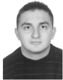
ΛΕΡΙΑΣ ΕΛΕΥΘΕΡΙΟΣ ΠΟΛΙΤΙΚΩΝ ΜΗΧΑΝΙΚΩΝ ΕΜΠ