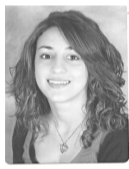
ΒΑΡΣΑΜΙΔΗ ΑΠΟΣΤΟΛΙΑ ΠΟΛΙΤΙΚΩΝ ΜΗΧΑΝΙΚΩΝ ΕΜΠ