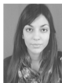
ΔΙΑΚΟΣΑΒΒΑ ΑΛΕΞΑΝΔΡΑ ΚΟΙΝΩΝΙΚΗΣ ΕΡΓΑΣΙΑΣ ΤΕΙ ΚΡΗΤΗΣ