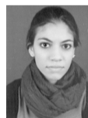
ΕΥΘΥΜΙΑΔΟΥ ΑΣΤΡΑΔΕΝΗ ΒΙΟΛΟΓΙΑΣ ΠΑΝ/ΜΙΟ ΑΘΗΝΩΝ