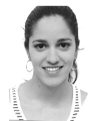
ΠΑΡΑΣΚΕΥΑ ΔΗΜΗΤΡΑ ΔΙΕΘΝΩΝ ΟΙΚΟΝΟΜΙΚΩΝ ΣΧΕΣΕΩΝ & ΑΝΑΠΤΥΞΗΣ ΠΑΝ/ΜΙΟ ΘΡΑΚΗΣ